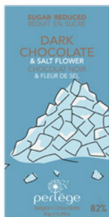
noir & fleur de sel dark & fleur de sel REF 3111