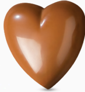
cœur* lait & praliné crunch milk & crispy praliné