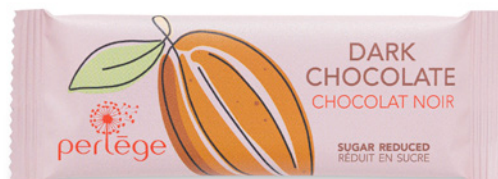
chocolat noir dark chocolate REF 3901 (24pc.)