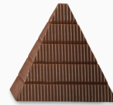
tahaa* ganache noire dark ganache