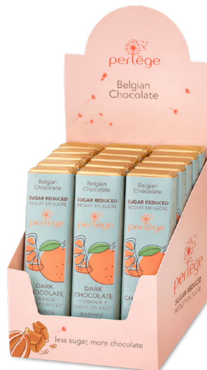
15 bâtons ou 30 bâtons 15 or 30 bars