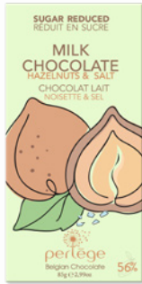
lait, noisettes & sel milk chocolate, hazelnuts & salt REF 3106