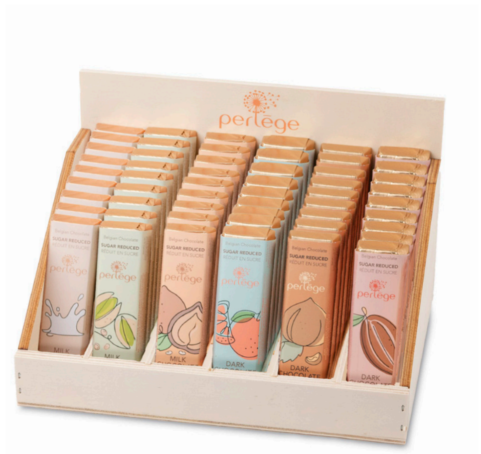
Display Bois Bâtons Perlège