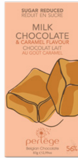
lait & caramel milk & caramel REF 3109