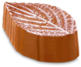
caramba* ganache caramel caramel ganache