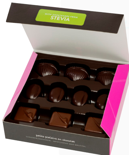
10 pralines lait & noir 125 gr 10 dark & milk pralines 125 gr 6 boîtes par carton / 6 boxes per carton