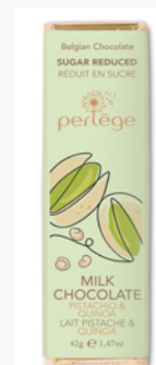
lait, pistache & quinoa milk chocolate, pistachio & quinoa REF 3218 (15pc.)