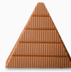
tikehau* ganache lait milk ganache