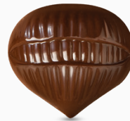
nutty* ganache coco coconut ganache