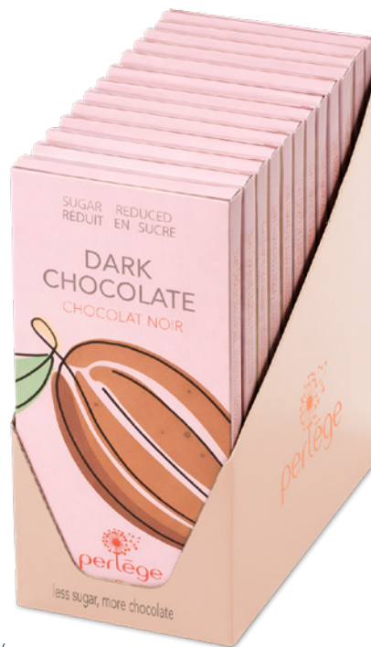
display 12 tablettes / 12 tablets