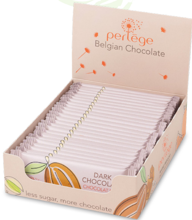
Display la petite Perlège