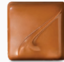
creolo* lait praliné milk praliné