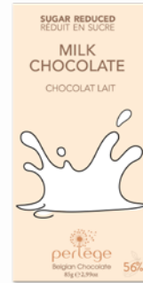
chocolat lait milk chocolate REF 3105