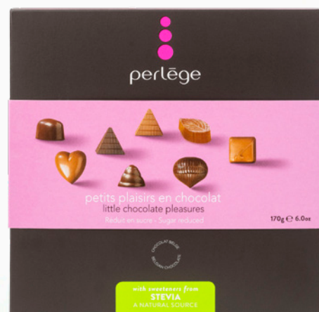
16 pralines assorties 170 gr 16 assorted pralines 170 gr 12 boîtes par carton / 12 boxes per carton