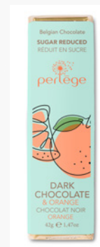
noir & ganache orange dark chocolate & orange ganache REF 3203 (15pc.)