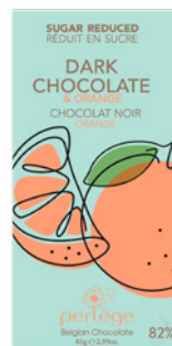
noir & orange dark chocolate & orange REF 3102